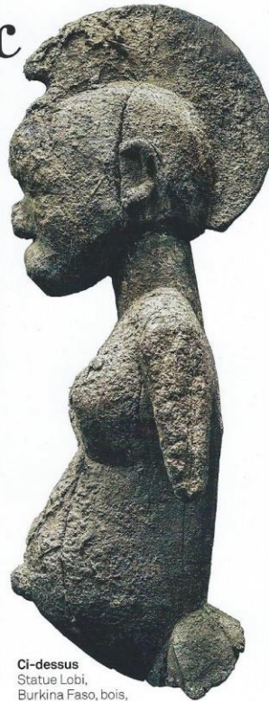
Ci-dessus Statue Lobi, Burkina Faso, bois, patine, H. 56 cm COLL. PRIVÉE.